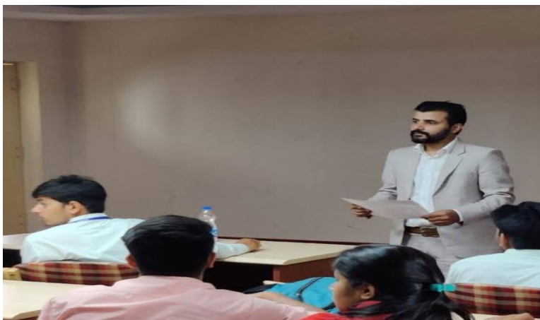
Faculty interacting with students